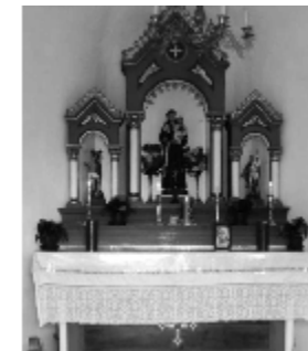
Altar des Antoniuskirchleins in Gereuth/Afers