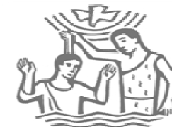
Taufe des Herrn DdM: Kirche Ulm